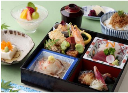
「カウンター割烹 みおつくし」 季節の松花堂弁当